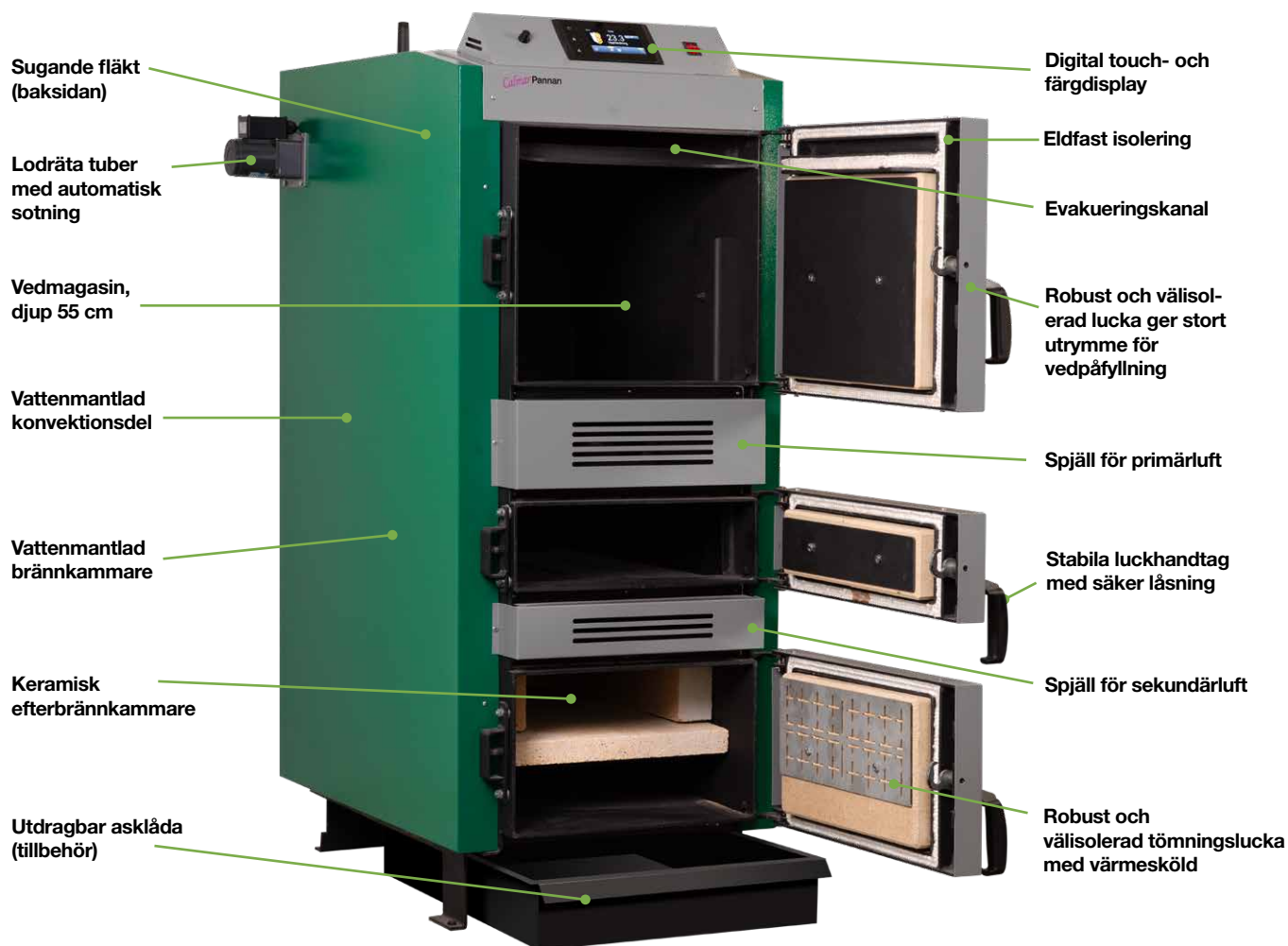
Calmarpannan V40 Ecodesign.