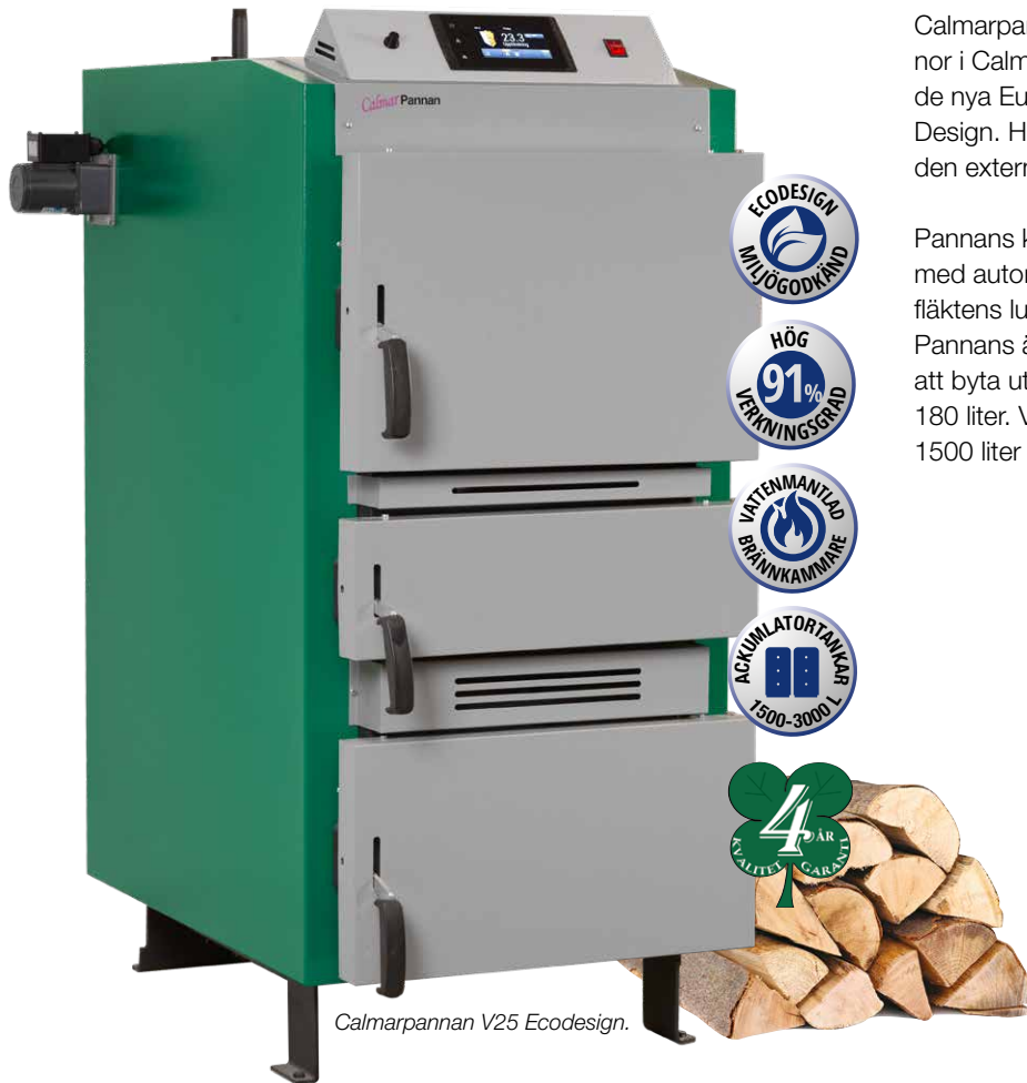
Calmarpannan V25 Ecodesign.

Calmarpannan V25/V40 Ecodesign är två nya vedpannor i Calmarpannan serien. Utvecklade för att uppfylla de nya Europakraven EN 303-5:2012 (klass 5) och Eco Design. Här laddar du pannan full, tänder veden genom den externa tändningsluckan i mitten.